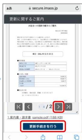
③ ご案内書をすべて確認し、「契約手続きを行う」を押します。