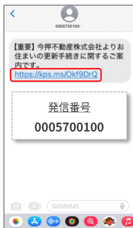
① 署名依頼のショートメールのリンクを押します。

運転免許証、パスポート、マイナンバーカード、保険証（記号・番号・枝番・保険者番号をマスキング）、住民基本台帳カード（顔写真つき）、在留カード