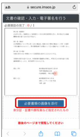
⑤ 契約書を最後まで閲覧し、画像添付ボタンを押し、身元証(※)をカメラ撮影します。