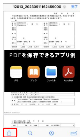
⑪ 契約書が表示されたら、左下の共有ボタンで、保存するアプリを指定します。