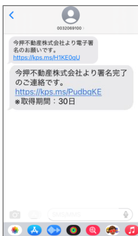
⑨ 署名完了の通知メールが届きましたら、URLから契約書をダウンロードします。