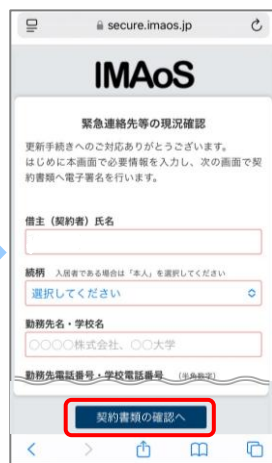
④ 勤務先や緊急連絡先、同居人等を入力し、「契約書類の確認へ」を押します。