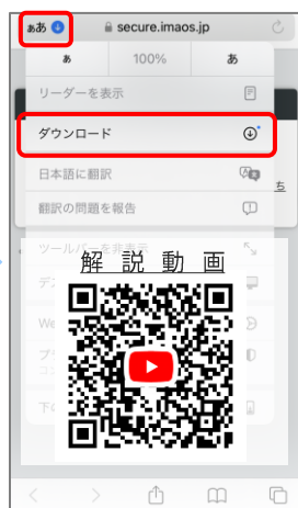
⑩ iPhone/Safariはアドレスバーの青い矢印を押し、ダウンロードを選択します。