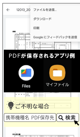
⑫ 契約書は「Files」や「マイファイル (Galaxy)」などに保存されます。