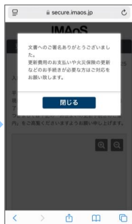
⑧ 以上で契約手続きは完了です。期日までに更新料のお支払いもお願いします。