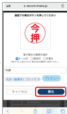
⑦ 印影が表示されますので一度「署名」を押します。