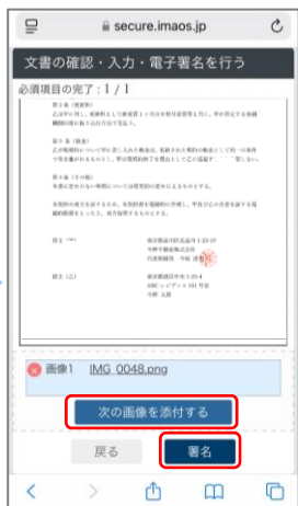
⑥ 裏面も添付する場合は同じ操作を行い、終わりましたら「署名」を押します。